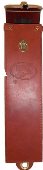
Fodral typ DFO/TAG Passande till spännings- provare typ TAG