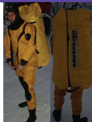
Lett å bære