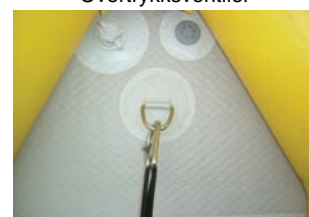
Feste for sikkerhetssele