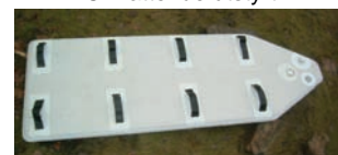
Avtagbar bunn (bære)