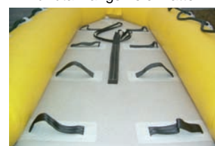
Fotfester og sikkerhetssele